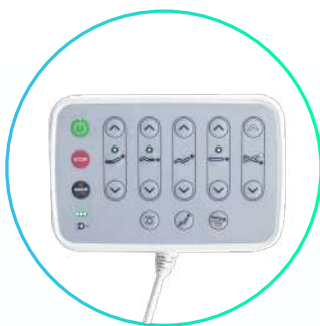
Control eléctrico principal