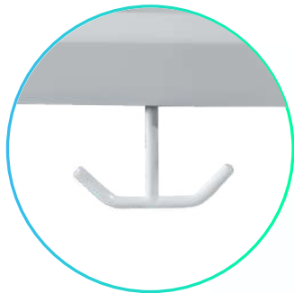
Gancho bolsa de drenaje