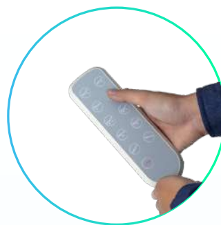
Control del paciente